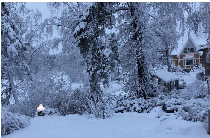
Storängens Strandväg i vinterskrud 2019.