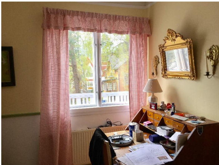
Miljöer i våra hus är intressanta.

Intresset för området finns av flera skäl. Att veta mer om det område man just har flyttat in i eller att påminnas om hur det var när ens föräldrar kom hit, då området var ett nybygge. Den kulturhistoriska betydelsen avspeglar sig även i ekonomiskt avseende. Ett område med en historia är ofta mycket eftertraktat.