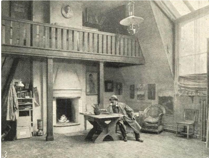
Georg Pauli i stora ateljén år 1906.

Intresset för området finns av flera skäl. Att veta mer om det område man just har flyttat in i eller att påminnas om hur det var när ens föräldrar kom hit, då området var ett nybygge. Den kulturhistoriska betydelsen avspeglar sig även i ekonomiskt avseende. Ett område med en historia är ofta mycket eftertraktat.