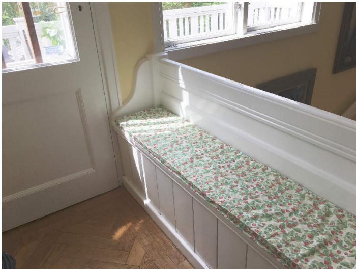
Detaljer i våra hus är intressanta.

Materialet kommer att arkiveras i Nacka Lokalhistoriska Arkiv i Dieselverkstaden, där det redan finns mycket intressant information om området. Arkivet har uppdaterats av flera personer som länge bott i Storängen.