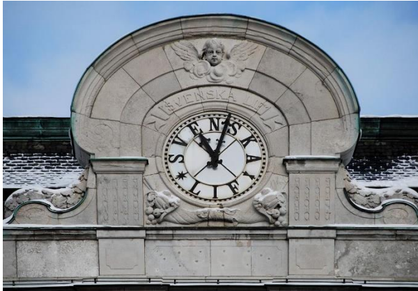
Klockan med bolagets namn på Svenska Lifs hus vid Norrmalmstorg.