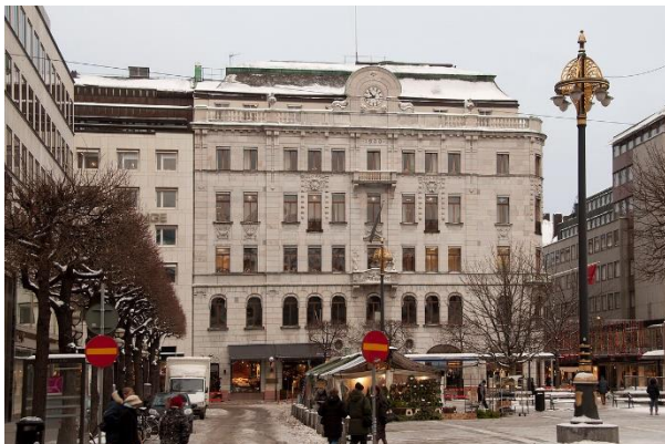
Svenska Lifs hus vid Norrmalmstorg