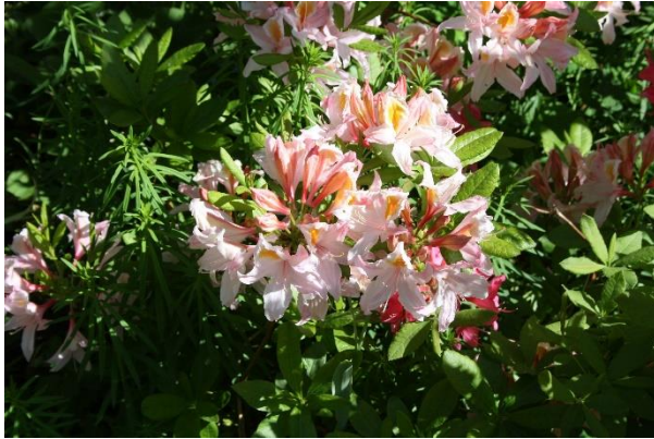
Välj bort röda blommor.