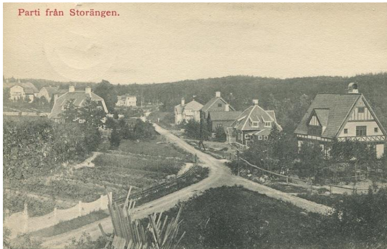
Vykort från Storängen