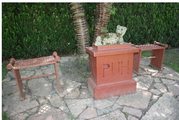
En Puh-plats att vila på

Brandförsvaret sköttes på egen hand och man ansvarade för vägarna och renhållningen genom anställd. Skolundervisning bedrevs först i liten skala och så småningom byggdes en skolbyggnad för många elever och med en samlingsal. Mycket av det som numera sköts av samhället tillkom här på privata initiativ.