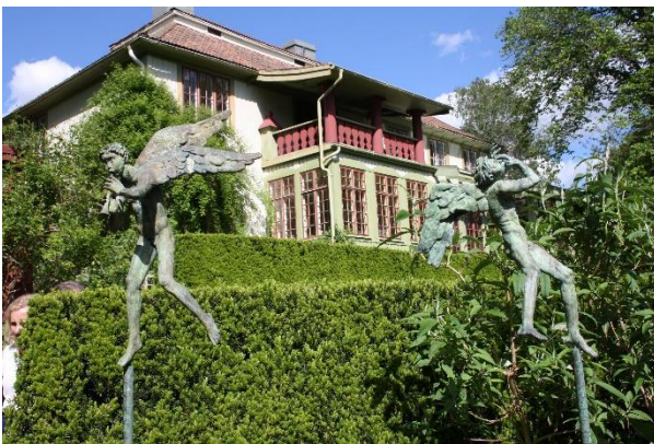
Villa Belander i Björkströms trädgård