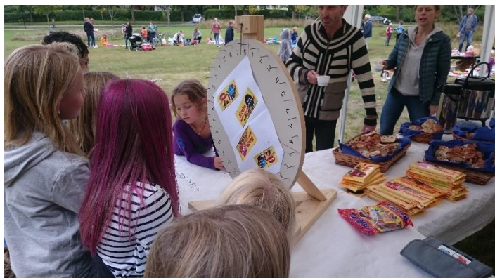
Lyckohjulet är poppis på Ängsfesten

Årets Ängsfest går av stapeln söndagen den 8 september kl 14-16 och arrangeras som tidigare av Storängstraktens Villaägarförening och Tjänstemännens Egnahemsförening tillsammans. Alla boende i Storängstrakten är välkomna att fika, umgås och sälja grejer på loppis.