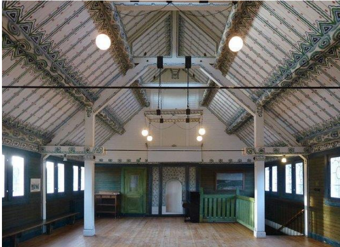
Storängssalen - kom hit den 18 augusti klockan 13-15

Vi behöver tillsammans med dig som är medlem diskutera några viktiga strategiska frågor. Vi ser detta som en del i att ta fram en strategi där vi fastställer en vision, en verksamhetsidé ett antal mål och strategier för att nå målen.