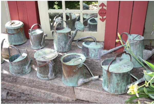
Många vattenkannor är det....