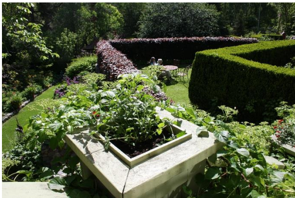
Flera rum hör till den nationalromantiska trädgården.

- När vi kom hit för 40 år sen sa Olle: jag piper ut mellan patienterna och jobbar i trädgården. Så blev det inte... Han har alltid gillat "armchair gardening", avslöjar Eva som tack vare sin konstnärliga utbildning har erövrat trädgården bit för bit. Och visst har Olle också dragit sitt strå till stacken.