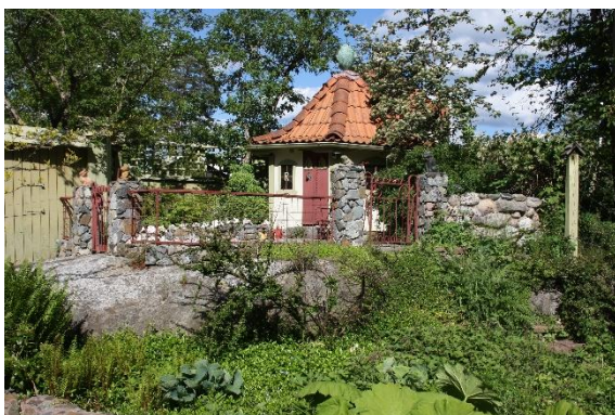
Lekstugan skymmer korsningen.

Ett annat tips för trädgården är att inte ha händelser överallt. Lugn behövs för att man ska kunna uppskatta det som är livligare i trädgården. Skulpturer är bra att falla tillbaka på, något att fästa blicken på.