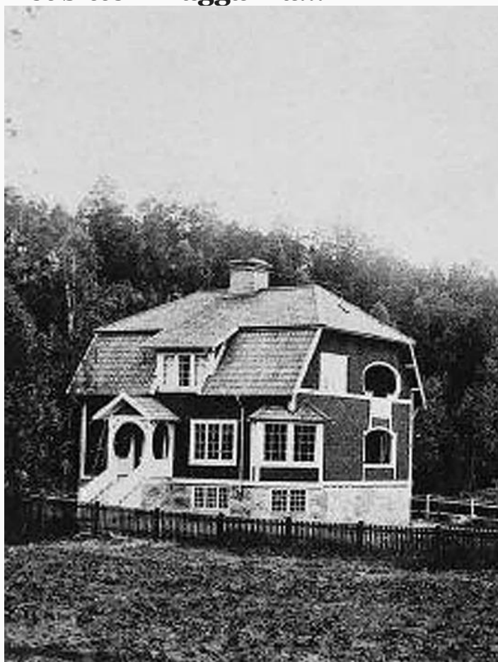
Storängens Strandväg 3 omkring år 1917

Under några år på 1900-talet bodde Miras mormor och morfar i Storängen i Nacka, och hennes morfar beskriver i sin dagbok hur de flyttar dit 1917 från Forsbacka och reder sitt hem där. Förmodligen bodde familjen i huset till 1921.