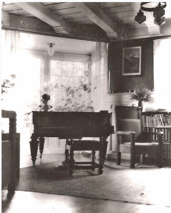
Interiör Storängens Strandväg 3 för 100 år sedan.

Men så ha vi fått ett nytt, större allmogeskåp, ett äkta leksandskt s.k. kronskåp, med årtalet 1790. Äfven detta skåp är orestaurerat och ser så förnämt ut med sina väl bibehållna färger, dämpade af ålderns patina. Det går i ungefär samma färger som det förra, hörnskåpet, men står på en högre social nivå än detta, som nog i alla sina dagar stått hos genuint bondfolk i Mockfjärd.